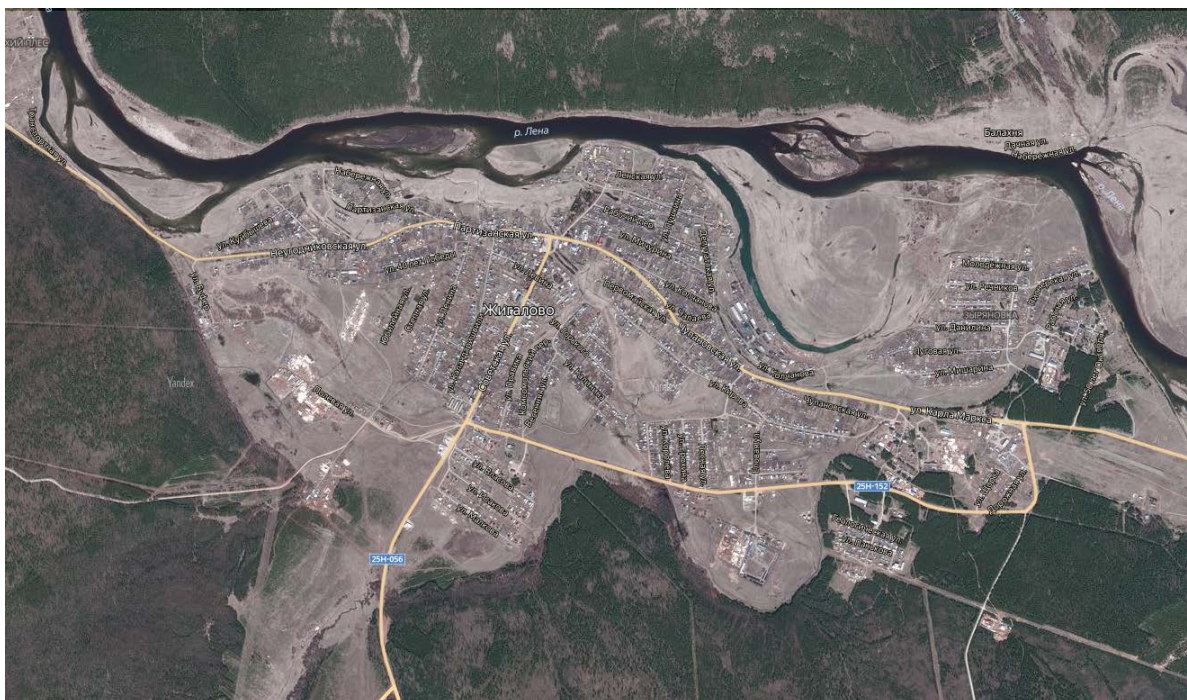
Рисунок 3.1. Расположение р.п. Жигалово